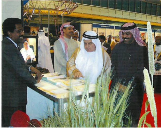
زوار جناح المركز في معرض دبي الدولي لتقنيات المياه والطاقة والبيئة