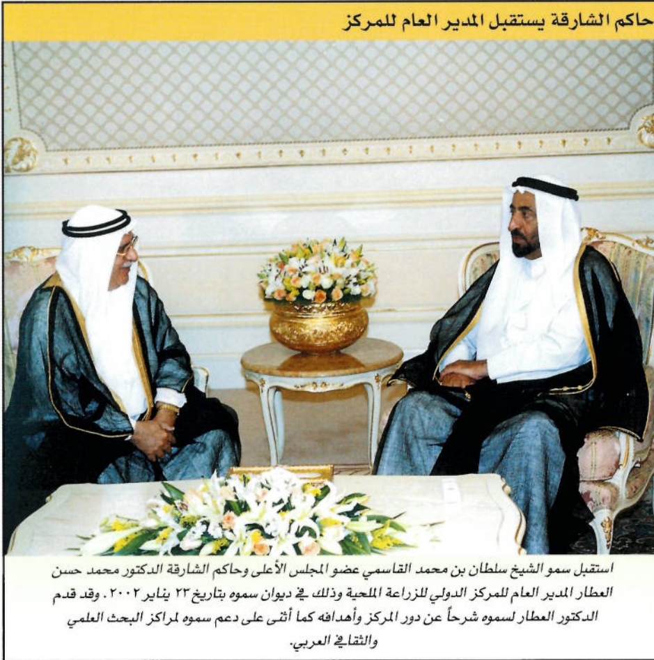
حاكم الشارقة يستقبل المدير العام للمركز