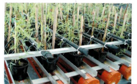
اختبارات التأقلم مع الملوحة في المركز: (من اليمين إلى اليسار)

اختبار الأوص، اختبار نبات القرم في مقياس التخلل بالتعاون مع هيئة أبحاث البيئة والحياة الفطرية وتنميتها، والدراسات الحقلية